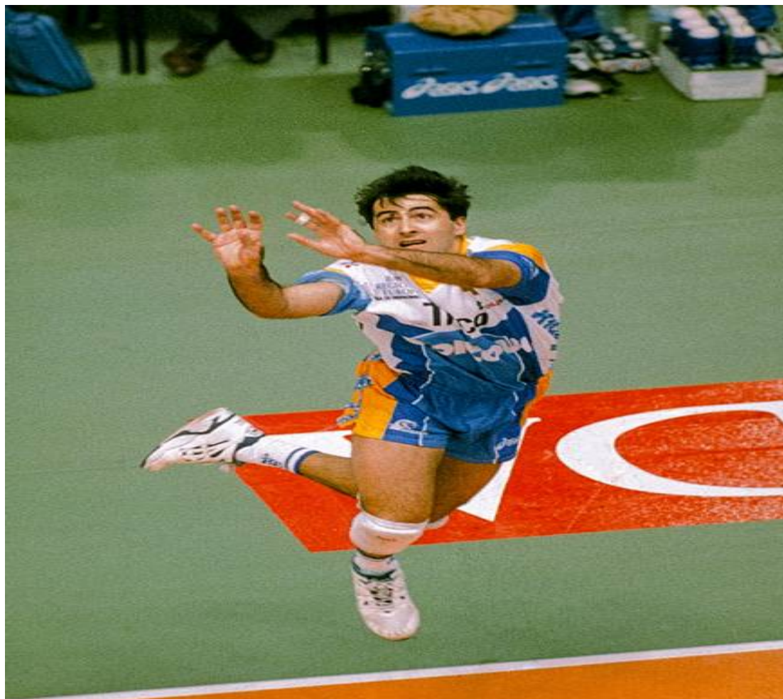
Ferdinando De Giorgi