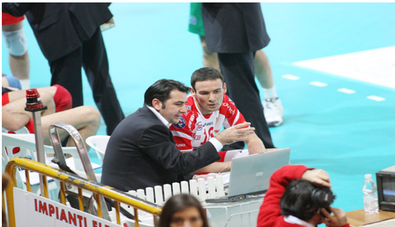
Ferdinando De Giorgi