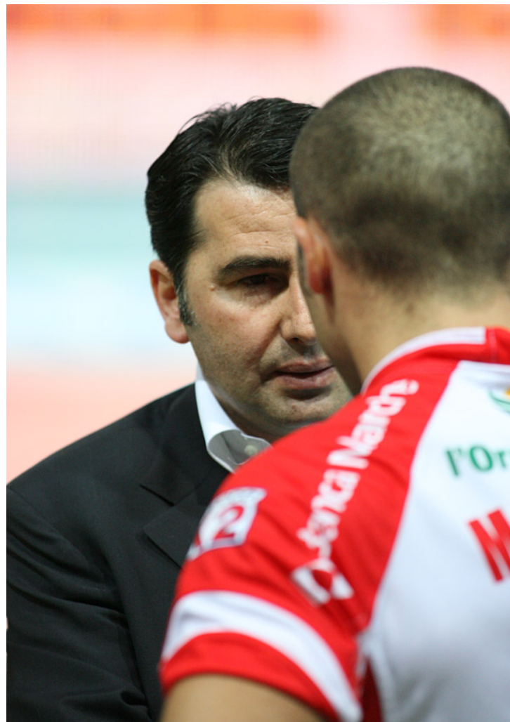
Ferdinando De Giorgi